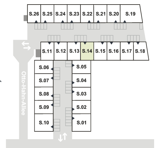
Otto-Hahn-Allee 35 - 37